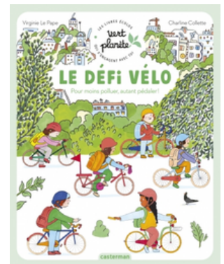
"Le défi vélo" Virginie Le Pape