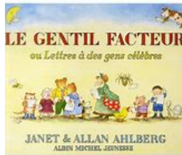
"Le gentil facteur" Janet et Allan Ahlberg