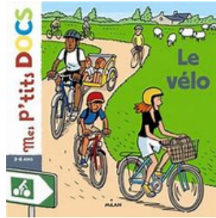
"Mes p'tits docs - Le vélo"