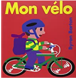
"Mon vélo" Byron Barton