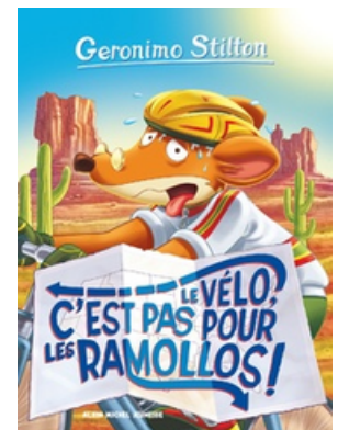
"Le vélo c'est pas pour les ramollos" - Geronimo Stilton