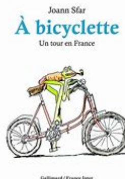
"À bicyclette" Joann Sfar