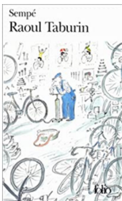
"Raoul Taburin" Sempé