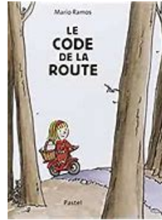
"Le code de la route" Mario Ramos