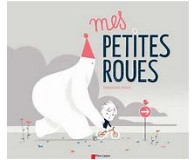
"Mes petites roues" Sébastien Pelon